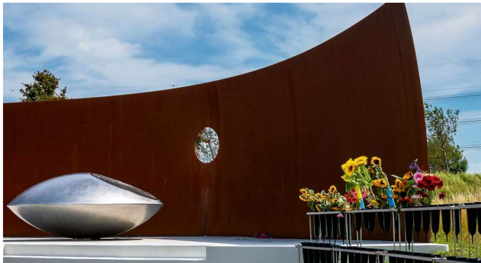
Bloemen bij Nationaal Monument MH17 in het herinneringspark bij Vijfhuizen, niet ver van Schiphol. Het is deze woensdag precies tien jaar geleden dat de MH17-ramp zich voltrok.

Evangelicals danken God en voelen zich nog meer met Trump verbonden pagina 5